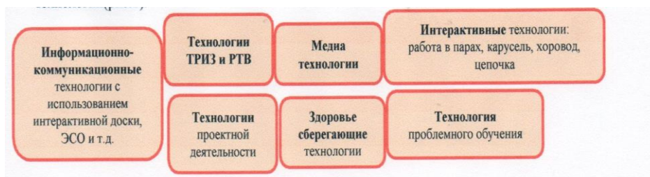
Рисунок 2. СОТ

Повышение эффективности образовательного процесса происходит благодаря внедрению в воспитательно-образовательный процесс детского сада современных педагогических технологий (рис.2).